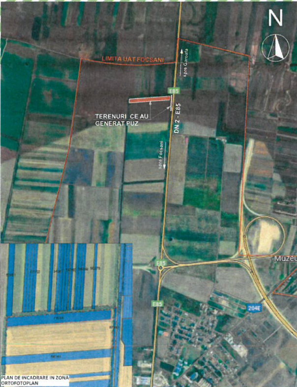
PLAN DE INCADRARE IN ZONA